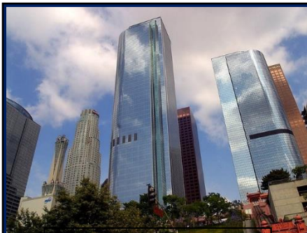
ダウンタウンのビル群