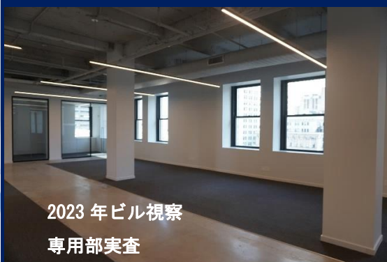
2023 年ビル視察 専用部実査