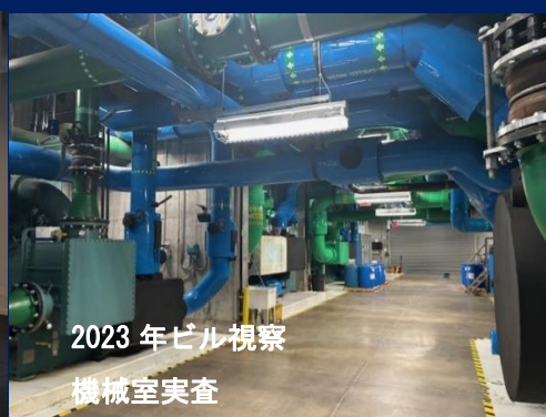
2023 年ビル視察 機械室実査