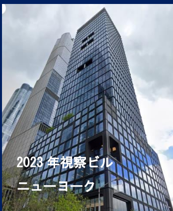
2023 年視察ビル ニューヨーク

出発前研修・視察地研修・帰国後研修の三部構成により 短期間で大きな研修成果を狙います