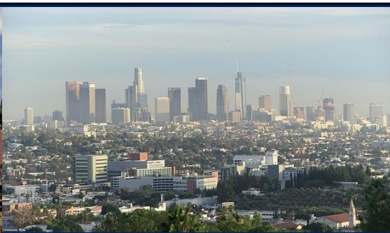
ロサンゼルス街並み